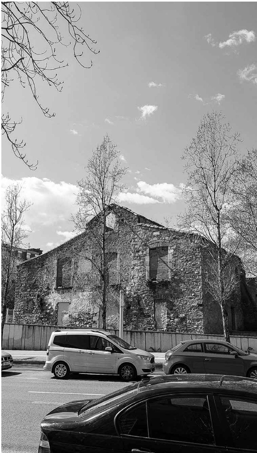
La masia de Can Valent necessita una reforma urgent. Joan Linux / 9 Barris Imatge