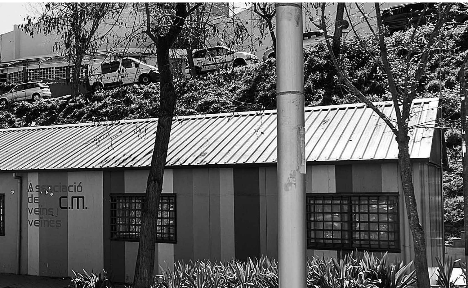
El local de la AV de Ciutat Meridiana lleva 25 años de "provisionalidad".

había aprobado la mejora de tres recintos de juego infantil en 2016. A día de hoy no sólo no han hecho nada sino que uno de los parques infantiles lo han adaptado como pipi-can, sin que por ello la guardia urbana haya intervenido para sancionar a los infractores.