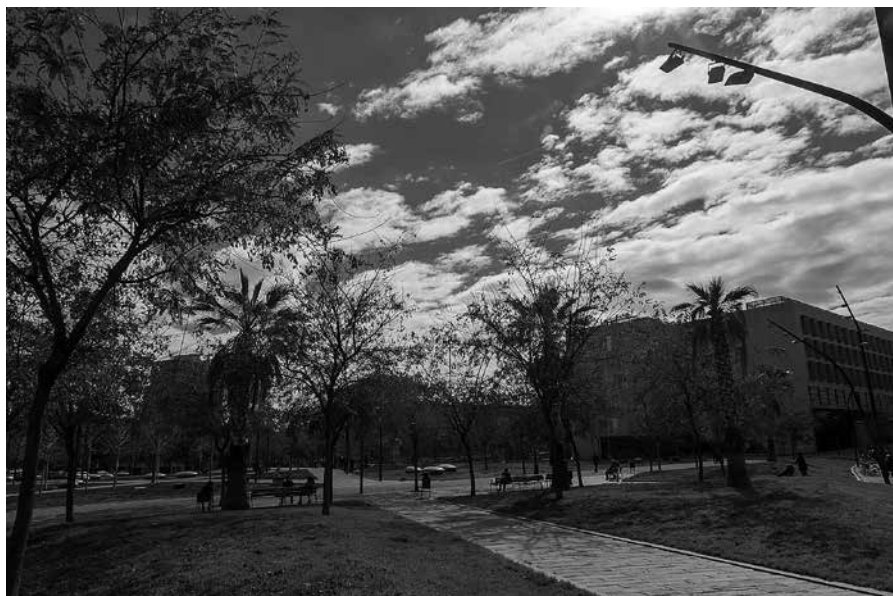
L'escola bressol que podria ubicar-se als Jardins de Can Xiringoi.

Es dona el cas que els tres són de titularitat pública, o estan en tràmits d'expropiació.