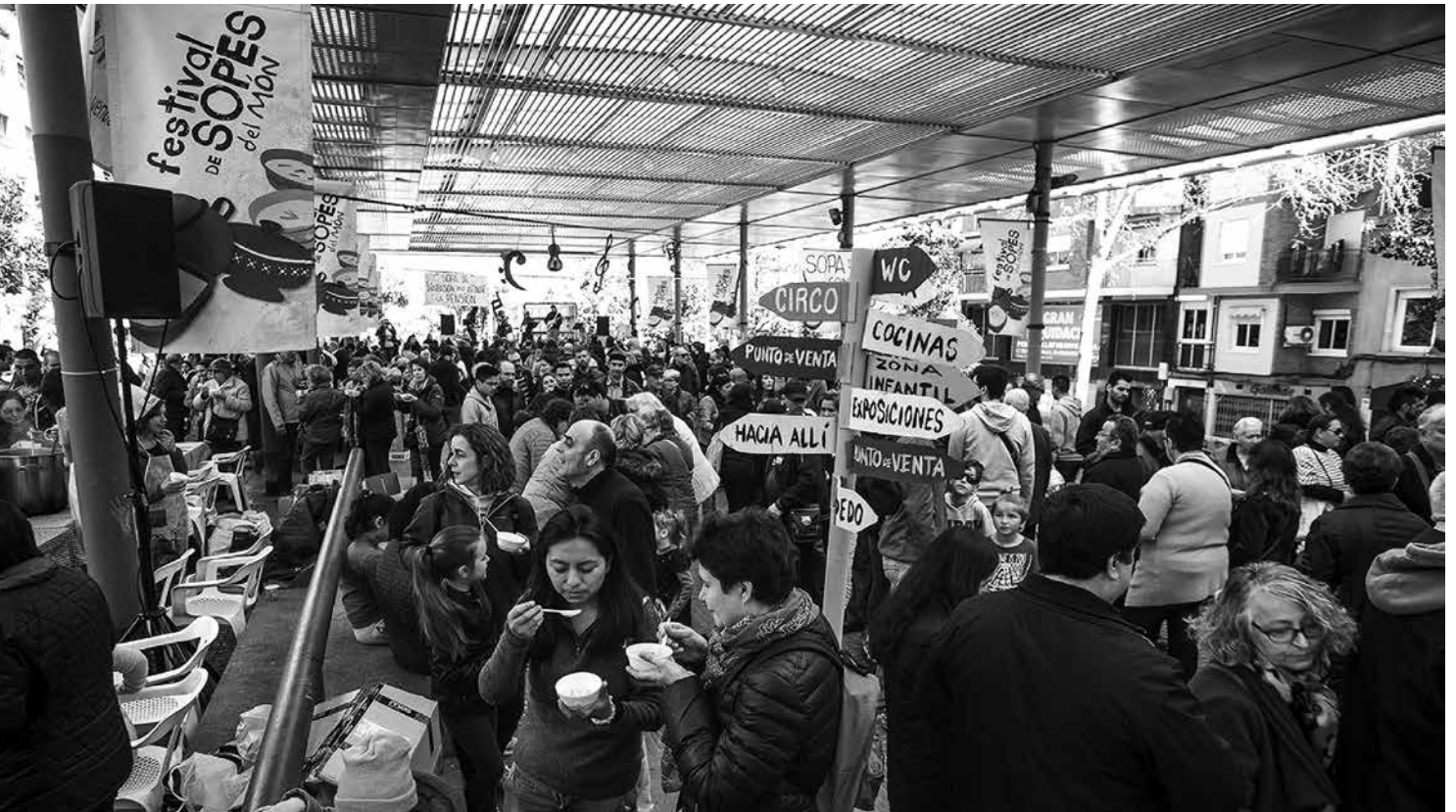
El 18 de marzo Nou Barris celebró 15 años de Festival de Sopas.