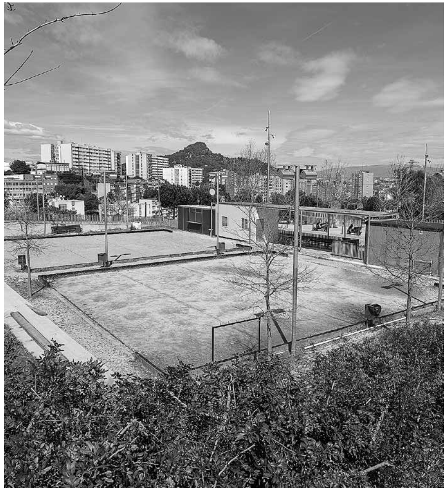
Torre Baró reclama la mejora del Campillo de la Virgen.

tierra, etc. E instalar la Pérgola-Marquesina solicitada desde tiempos del anterior equipo de gobierno municipal en la zona del Campillo de la Virgen.