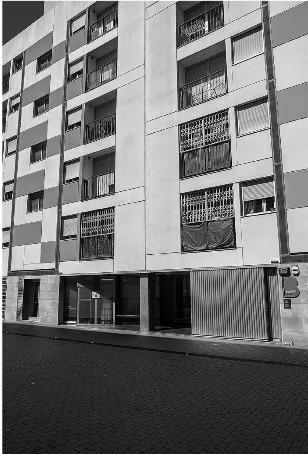
El Casal de barri necessita una empena econòmica per part de l'Ajuntament.