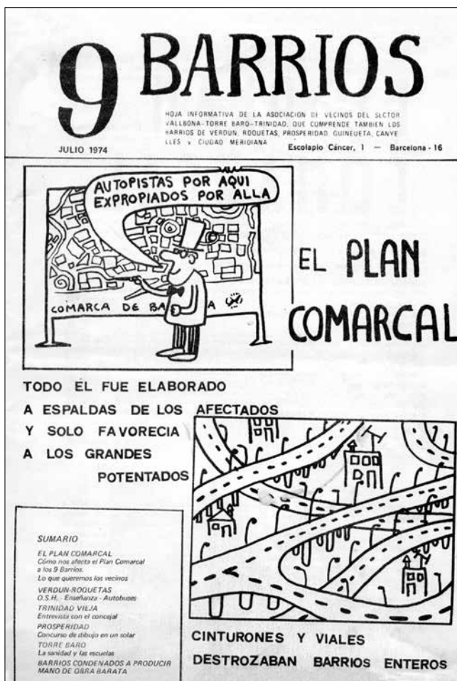
Revista "9 Barrios", juliol de 1974.

Si l'Associació de Veïns de 9 Barris es va anticipar en la transició a la democràcia, la Coordinadora s'ha avançat a l'hora de dibuixar el Nou Barris del segle XXI, apostant per un nou model de democràcia moderna i avançada basat en un poder de decisió popular on totes les veus importen.