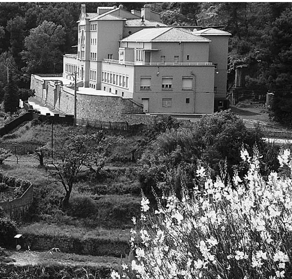
Sant Llàtzer porta mig segle d'abandó. Can Masdeu

transició cap a l'agricultura ecològica, inserir-la en els circuits curts comunitaris i assegurar la seva funció pública. A l'hospital abandonat de Sant Llàtzer, al límit territorial del districte d'Horta i dins de Collserola, s'està plantejant crear un ecosistema de projectes vinculats a l'agroecologia i el canvi climàtic, en continuïtat i col·laboració amb els projectes que han custodiat la vall de Can Masdeu els darrers setze anys.