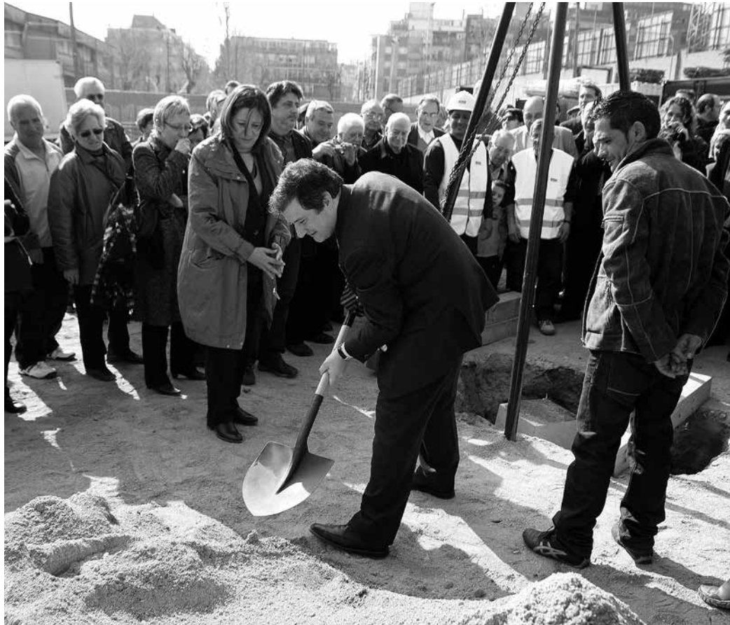
L'alcalde Hereu el 2009 posant la primera pedra d'una piscina que encara s'espera.

• Piscina municipal a Molí-Via Favència i acabar la urbanització de la zona. Reivindicació que ve dels anys 90. Amb pla especial (2005), primera pedra i pre-projecte (2009), avantprojecte de pressupost aprovat per la Generalitat (2011) i Ajuntament (2012). Contemplada al Pla d'Equipaments del 2011. El 2013 els diners s'esfumen i cau del PAM. Hem plantejat la reivindicació a l'actual