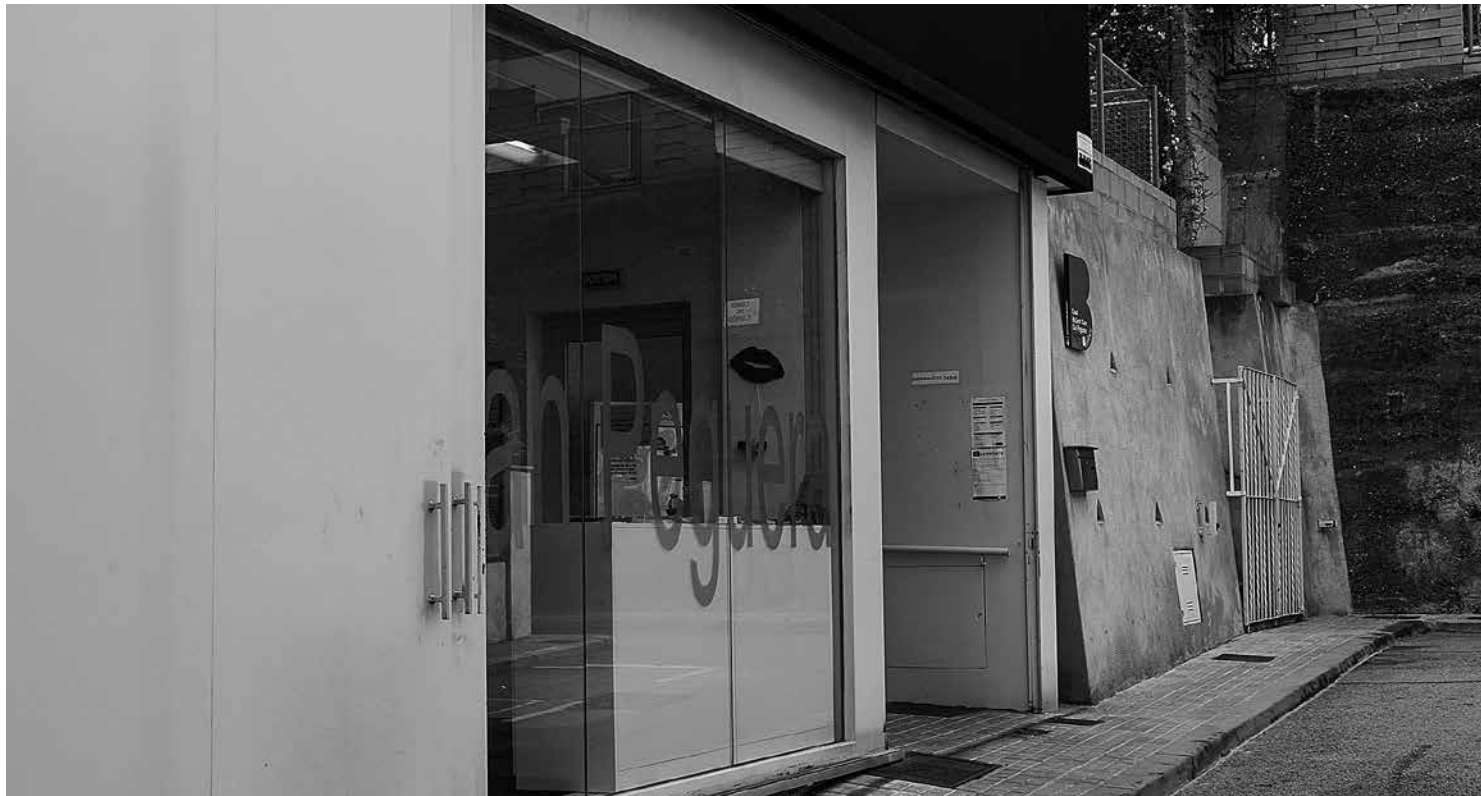
Can Peguera reclama que el Casal de la gent gran sigui de gestió comunitària.

P er començar a veure la situació dels equipaments a Can Peguera cal tenir en compte que estem una situació de “repensament” global del barri. Després de molta lluita veïnal, el 2016 el barri va ser desafectat del Pla General Metropolità que amenaçava la seva existència des de l’any 1945, i actualment estem treballant amb Patronat i Ajuntament per la millora integral del barri. Això ens donarà noves pistes sobre els nostres potencials i també sobre les carències.