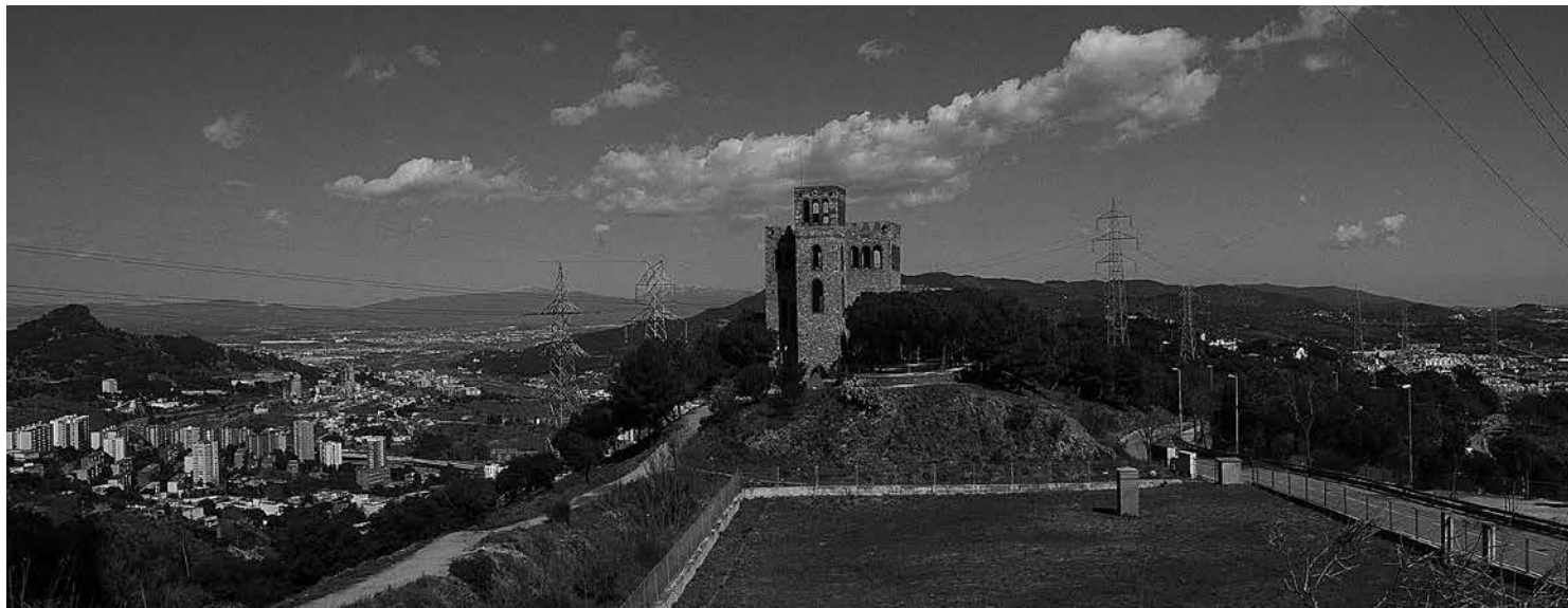
A Nou Barris no volem només equipaments, també volem participació.

Coordinadora d'Associacions de Veïnes i Veïns i Entitats de Nou Barris